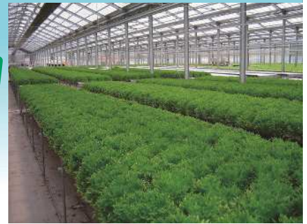
水耕栽培でも人気上昇中