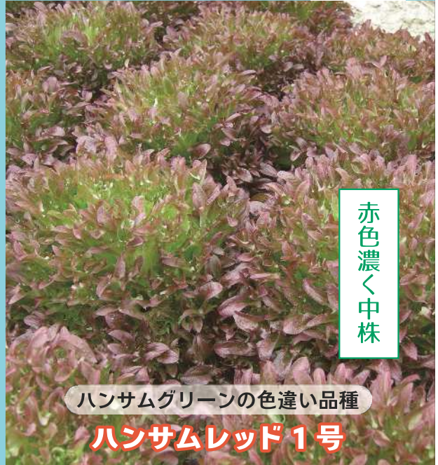
ハンサムグリーン