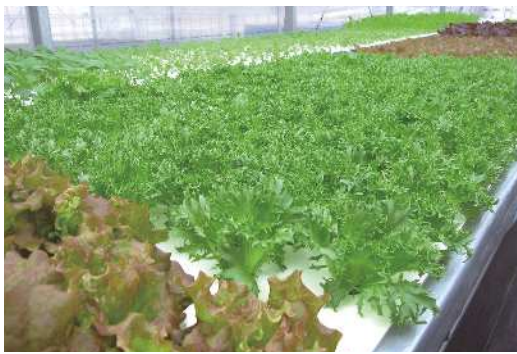
定番の畑やプランターで…